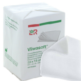
Compresse non stériles non tissées