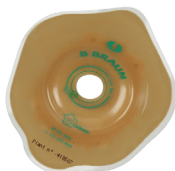
Support Flexima 3S