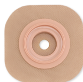
Support Conform 2