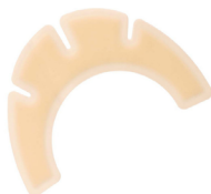
Renfort Eakin contour