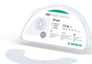
Ally Wafer extenders