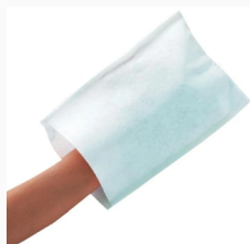
Gants de toilettes jetables