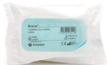
Lingettes pour toilette intime Brava