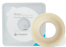
Anneau protecteur Brava