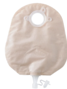
Natura + poche uro vidangeable